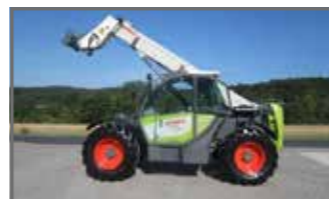
CLAAS SCORPION 9040 Bj. 2008, 5.016 h, 140 PS (103 kW) Tel.: 09666 18820-10