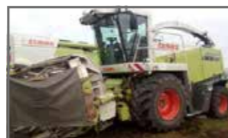
CLAAS JAGUAR 870 SPEEDSTAR Bj. 2007, 4.230 h, 460 PS (338 kW), A, BC Tel.: 03722 890726