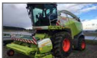
CLAAS JAGUAR 870 A Bj. 2016, 1.020 h, 598 PS (440 kW), ATR: 593, A Tel.: 07345 933370