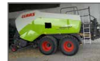
CLAAS QUADRANT 3200 FC TANDEM Bj. 2014, 19.400 Tel.: 08457 74888