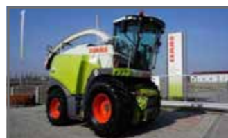
CLAAS JAGUAR 950 ALLRAD Bj. 2013, 998 h, 598 PS (440 kW), ATR: 593, A Tel.: 08631 1675619