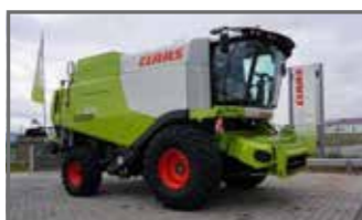
CLAAS LEXION 670 mit VARIO 770 Bj. 2015, 688 h, ATR: 593, ACT, BC Tel.: 08631 1675619