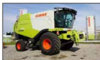
CLAAS LEXION 630 MONTANA mit VARIO 660 Bj. 2015, 499 h, 359 PS (264 kW) Tel.: 08631 1675619