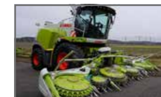
CLAAS JAGUAR 950 MIT ORBIS 750 Bj. 2014, 1.954 h, 598 PS (440 kW) Tel.: 08733 9285-24