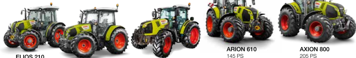
ELIOS 210 75 PS 1.250,- € 4