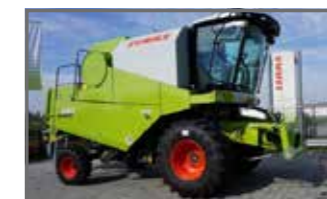
CLAAS AVERO 240 Bj. 2016, 100 h, 205 PS (151 kW) Tel.: 08631 1675619