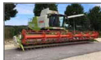
CLAAS LEXION 760 TT Bj. 2011, 1.687 h, 530 PS (390 kW), ATR: 593, ACT, BC Tel.: 07345 933370