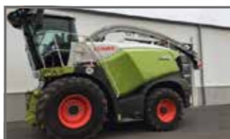
CLAAS JAGUAR 950 SPEEDSTAR Bj. 2017, 610 h, ATR: 593, A, AHVauto Tel.: 07345 933370