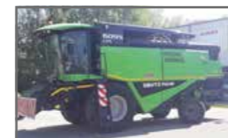
Deutz-Fahr 6095 HTS BALANCE Bj. 2012, 1.052 h, 396 PS (291 kW) Tel.: 08457 74888