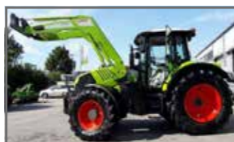
CLAAS ARION 650 CMATIC Bj. 2016, 1.455 h, 185 PS (136 kW), ATR: 1100 Tel.: 08457 74888